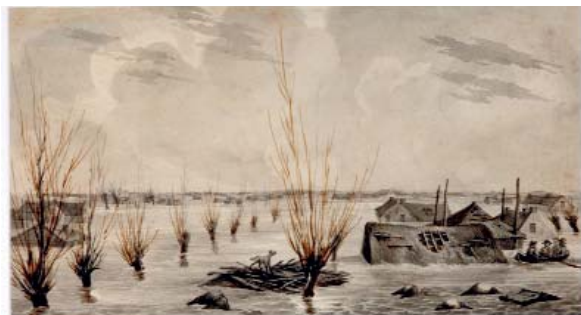
Anoniem, De watersnoodramp bij Wolvega, 1825 (collectie Fries Museum Leeuwarden)

de jaartallenlijst die kinderen vroeger op school leerden, somt Kees Slager alle overstromingen op die het deltagebied van Maas en Schelde hebben getroffen. Dat is geen overzicht ‘met overwinningen en veroveringen’, maar een ‘lijstje van louter nederlagen’, aldus Slager. 11