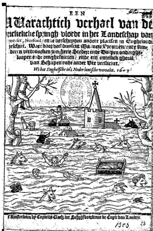
Het pamflet Een Warachtig verhael van de schrickelike springh-vloedt uit 1607 (Knuttel pamflettencatalogus, 1353)

Behalve in het Augsburger Wunderzeichenbuch komt het motief ook voor in een Engels pamflet dat handelt over een stormvloed bij Bristol op 20 januari 1607. 15 Op de titelpagina daarvan prijkt een kindje in een wieg. Van het pamflet is een Nederlands-talige vertaling overgeleverd, getiteld Een Warachtig verhael van de schrickelike springh-vloedt in het Landtschap van Somerset, Norford, ende verscheyden andere plaetsen in Enghelandt geschiet . 16 De gebruikte afbeelding is exact dezelfde als op het