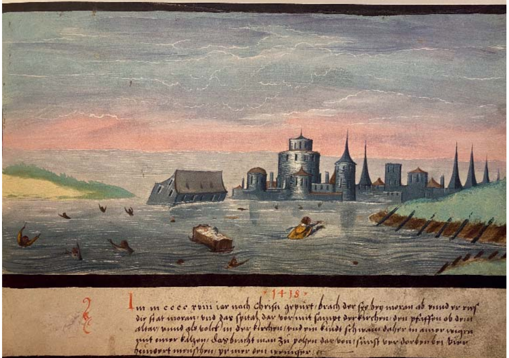
Fol. 75, 'Überschwemmung bei Meran 1418' ( Augsburger Wunderzeichenbuch , ed. Borchert en Waterman, 2013)

Daarna kwam het verhaal terecht in een boek van de humanist Martin Dorpius uit 1514, waarna andere zestiende- en zeventiende-eeuwse geleerden het relaas kopieerden. 12 Intussen circuleerden er ook voorstellingen van een kindje in een wieg in andere bronnen. In het Augsburger Wunderzeichenbuch , dat rond 1550 in de omgeving van Augsburg werd vervaardigd, komen twee illustraties voor waarop een kindje in de wieg te zien is. Op de eerste is in het midden een kind in een wieg te zien met een kleine zwarte kat erop. Het betreft een overstroming van het meer bij Merano in 1418, en het kind zou zijn gered bij Bolzano. 13 De andere illustratie toont een overstroming van de Rijn nabij Heidelberg in