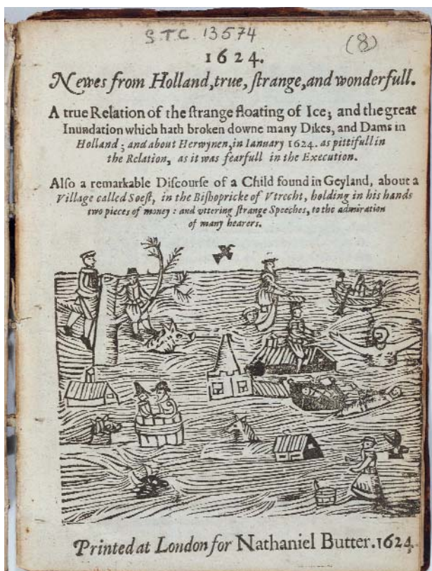
Newes from Holland. Engels nieuwspamflet over de overstroming van de Lek bij Vianen in 1624

Datzelfde geldt voor een pamflet over een dijkdoorbaak in 1624: Newes from Holland, true, strange, and wonderfull. A true Relation of the strange floating of Ice; and the great Inundation which hath broken downe many Dikes, and Dams in Holland; and