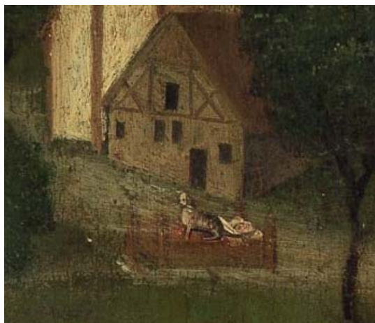
Detail van het altaarstuk van de Meester van de Heilige Elisabeth-Panelen (collectie Rijksmuseum Amsterdam)

De binnen- en buitenzijde moeten in samenhang met elkaar worden bekeken: de schilder beeldde de omgeving rond Dordrecht niet op realistische wijze uit, maar legde de nadruk op tafereelen van naastenliefde. 10 Hij alludeerde bovendien op afbeeldingen van het Laatste Oordeel, waarbij de heilige stad Jeruzalem doorgaans aan het einde van een slingerende weg werd gesitueerd, precies zoals Dordrecht aan het einde van een meanderende rivier lag. Het ging de schilder dus niet om een werkelijkheidsge-