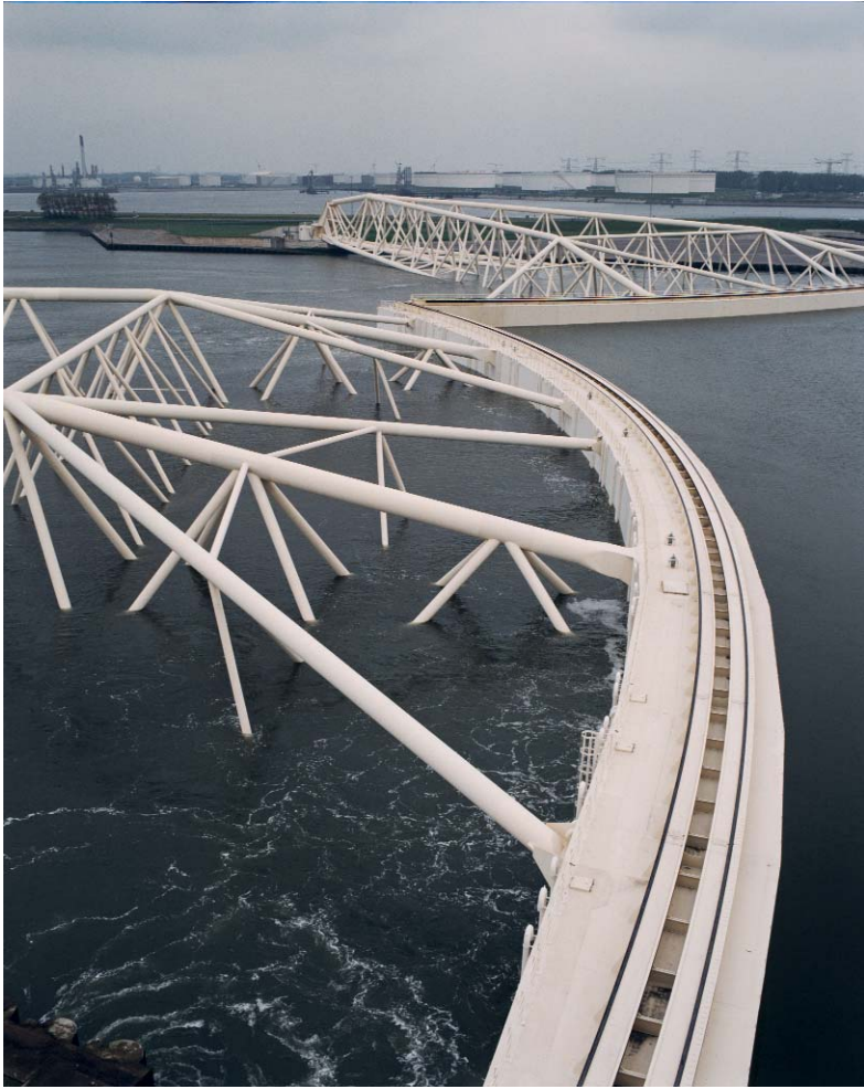
De Maeslantkering

neringscultuur. In de hiernavolgende hoofdstukken passeren deze vier pijlers achtereenvolgens de revue. Tezamen bepaalden ze het nationale narratief, waarin saamhorigheid en trots de bovenaan voerden, tot op de dag vandaag. Als de media maar vaak genoeg herhalen dat de strijd tegen het water typisch Nederlands is, zal het onze perceptie van de werkelijkheid beïnvloeden. 18